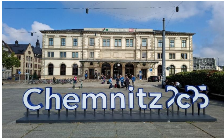
Der erste Hinweis auf die europäische Kulturhauptstadt 2025: Chemnitz am Hauptbahnhof

Denn das ist das Motto, unter dem die sächsische Industriestadt 2025 europäische Kulturhauptstadt war. „C“ steht dabei sowohl für Chemnitz als auch für das englische „to see“ („sehen“). Das Motto frei übersetzt heißt also „Das Ungesehene entdecken.“ Und das tat die Chamer Reisegruppe unter der Regie von KEB-Leiter Michael Neuberger während vier intensiver Tage.