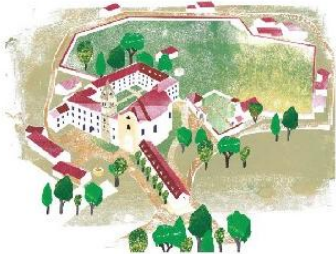
© „bauwärts“ / Skizze des Klosters Frauenzell, das als Logo dient

Das vielfältige Workshop-Angebot ermöglicht den Teilnehmenden, unterschiedliche Zugänge zur Stille kennenzulernen. Körper- und bewegungsorientierte Einheiten wie „Energie & Fokus“, Bambus Stock Qi Gong oder Kundalini-Yoga fördern die Wahrnehmung des eigenen Körpers und stärken die innere Präsenz. Meditative Spaziergänge sowie der Augenspaziergang laden dazu ein, die Umgebung achtsam wahrzunehmen und zur Ruhe zu kommen. Ergänzt wird das Programm durch Angebote wie Progressive Muskelentspannung, Atem und Schlaf sowie „Stille – Sein im Jetzt“, die Wege zu Entspannung und innerer Sammlung eröffnen.