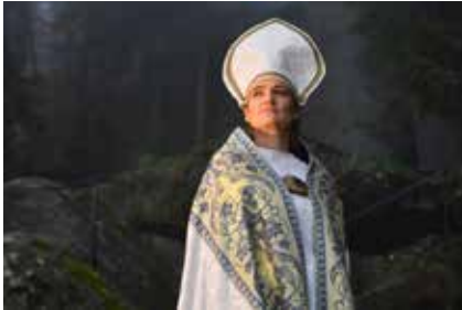
Die Päpstin

Bis heute ist sie eine Legende, die einzige Frau, die jemals auf dem Thron Petri residieren haben soll: Johanna von Ingelheim.