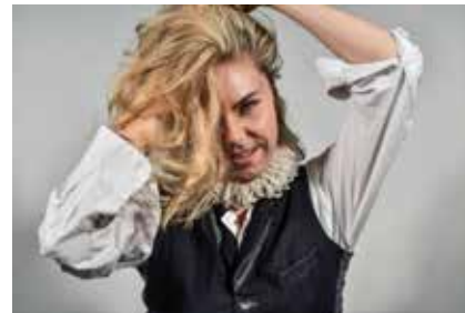
Shakespeare in Love

Will Shakespeare ist verzweifelt. Er muss schreiben, doch ihm fehlen die zündenden Ideen. Es mangelt ihm an Inspiration. Zum Glück betritt die zauberhafte Lady Viola die Szene und mit ihr